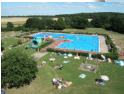
Hallen- und Freibad SZ-Thiede